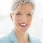
Projektleitung: Maria Janssen Süddeutscher Verlag Veranstaltungen GmbH

Neben Berichten aus erster Hand über die ständigen Neuerungen zum Gefahrgutrecht und praktische Hinweise zur korrekten Umsetzung haben Sie die Gelegenheit, sich über weitere wichtige Themen zu informieren: Wir wollen Ihnen durch Berichte aus dem Alltag von Gefahrgutbeauftragten Impulse für Ihre tägliche Arbeit geben. In den Vorträgen, Themenforen und Symposien werden Sie feststellen, was Gefahrgutbeauftragte, beauftragte Personen und weitere Verantwortliche rund um das Thema Gefahrgut wissen sollten; wir bereiten Sie mit unserem Referententeam Bestens darauf vor, Ihren Beitrag zu einer sicheren Beförderung gefährlicher Güter leisten zu können. Beachten Sie bitte die neue Auswahlmöglichkeit bei den Symposien am Mittwoch.