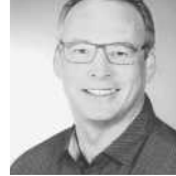
Jan Demetrio Evonik Logistics Services GmbH