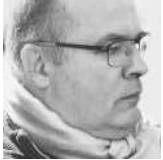
Dr. Thomas Arenz Scheren Logistik GmbH