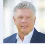
Dieter Reiter Oberbürgermeister der Stadt München