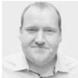
Lutz Kahlen HOYER GmbH Internationale Fachspedition