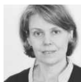
Dr. Gitta Weber Infraserv GmbH & Co. Höchst KG