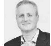
Martin Feldhege Schrader T+A Fahrzeug- bau GmbH & Co KG