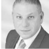
Karl Boentner Saexinger GmbH