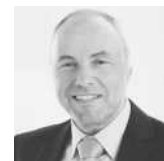
Herrmann Plasa Safety Training GmbH